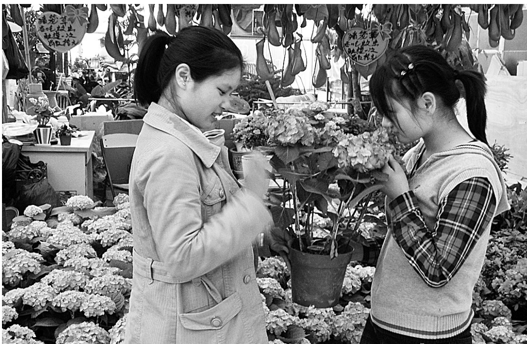
产于洛阳的绣球花以奇幻多变而闻名四方,昨日,从洛阳刚刚运来的绣球花一到陈寨花卉市场,就吸引了众多市民竞相购买。

每年清明前鸡蛋价格一般均处在较低水平,但由于今年天气反常,气温变化较大,蛋鸡产蛋量无法达到往年春季的高产水平,近期鸡蛋价格出现微弱回升态势。