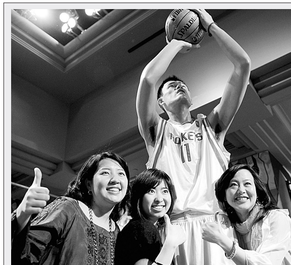
3月18日,三位女士在美国纽约杜莎夫人蜡像馆与姚明蜡像合影。当日,来自上海杜莎夫人蜡像馆的姚明蜡像开始在纽约杜莎夫人蜡像馆进行为期六个月的展出。