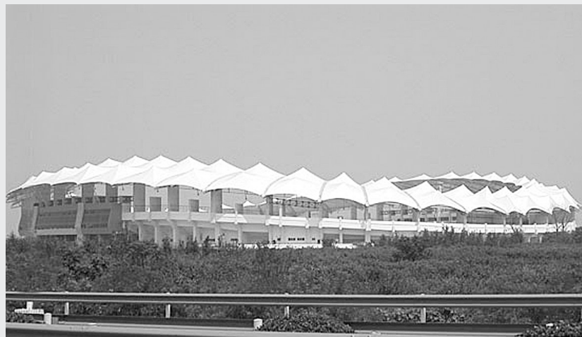
航海体育场静待中超开幕式的到来。

本报讯(记者 刘超峰 通讯员 刘洋)明晚,2009赛季中超联赛开幕式将在郑州航海体育场举行,今天晚上,中超开幕式的各项流程将在航体逐一彩排。