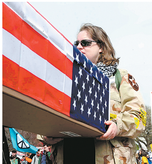
示威者抬着用纸箱做的棺材，上面覆盖着美国国旗。 示威群众高举“要和平不要战争”的标语牌。

据新华社洛杉矶3月21日电 数千美国民众21日在洛杉矶好莱坞大道举行反战集会和游行，纪念伊拉克战争爆发六周年。 示威群众高举“要和平不要战争”的标语牌，呼吁美国立即从伊拉克撤军。不少示威者佯装死人躺在地上，以悼念在伊拉克战场上身亡的美国军人。一些示威者抬着用纸箱做的棺材，上面覆盖着美国国旗。 参加示威游行的包括著名“反战母