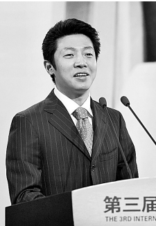
撒贝宁 毕业于北京大学法学院,中央电视台《今日说法》栏目主持人。

撒贝宁在接受记者采访时说,当前,要提高抗击金融风险的能力,最主要的力量来自于民族文化的特质,黄帝文化国际论坛将为我们传递出更多的动力。 本报记者 张冯焱 文 汪静文 图 更重要”,巧妙地介绍了论坛的意义。 撒贝宁在接受记者采访时说,当前,要提高抗击金融风险的能力,最主要的力量来自于民族文化的特质,黄帝文化国际论坛将为我们传递出更多的动力。 本报记者 张冯焱 文 汪静文 图