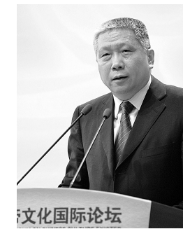
马未都 收藏专家,复夏博物馆创办人及现任馆长,央视《百家讲坛》主讲人。

在央视《百家讲坛》节目中把收藏讲得妙趣横生的马未都一出场,就带来了一股轻松幽默的讲坛之风和强烈的感染力。他含笑向大家透露自己是个河南女婿。 第三届黄帝文化国际论坛的主题是“信心·创新·复兴”。为什么要提复兴?马未都说,因为我们历史上有过非常辉煌的时刻。唐太宗曾经说过“以史为鉴可以知兴替”,我们的文化可能要决定我们今后的命运,我们的文化一定能给我们这个国家带来巨大的推动力,每一个参加拜祖大典的炎黄儿女,都会深受感动,这感动来自于文化。