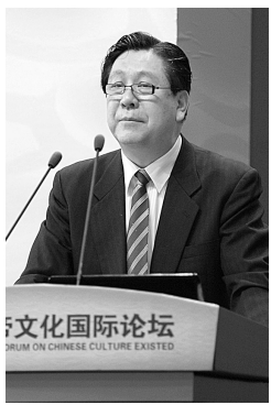
龚田夫 中国岩画研究中心主任,中央民族大学教授。主要研究艺术史论,著有《宁夏岩画》、《中国文化的岩画坐标》等。