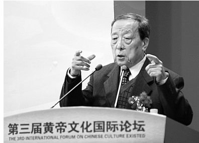
郑、到具茨山,因为这个地方是中华文明、黄帝文化的中心和发源地。本报记者 覃岩峰 文