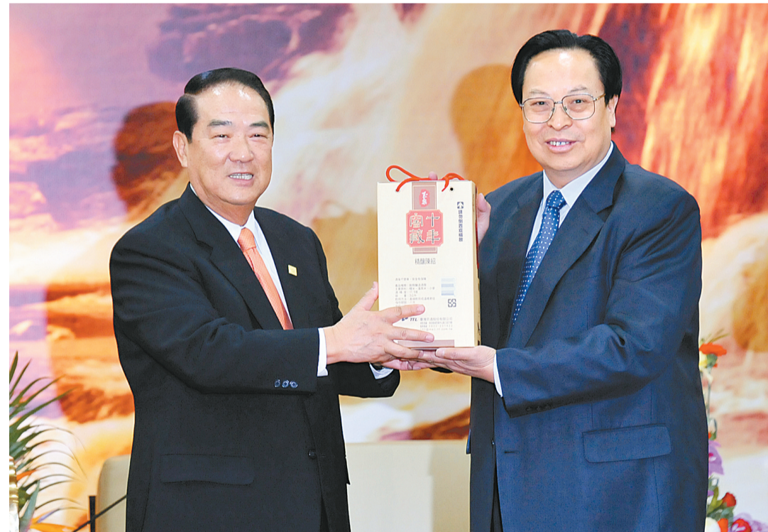
昨日,中共河南省委书记、省人大常委会主任徐光春在郑州国际会展中心,亲切会见来河南参加己丑年黄帝故里拜祖大典的亲民党主席宋楚瑜先生一行。图为双方互赠礼品。

徐光春说,宋主席此次河南之行,既是今年黄帝故里拜祖大典的一件大事,也为豫台进一步加强交流与合作提供了新的契机。我们真诚希望通过这次活动进一步推动双方文化交流、人员往来、合作大推动、发展大促进,共同促进两岸经济社会的繁荣发展。我们真诚希