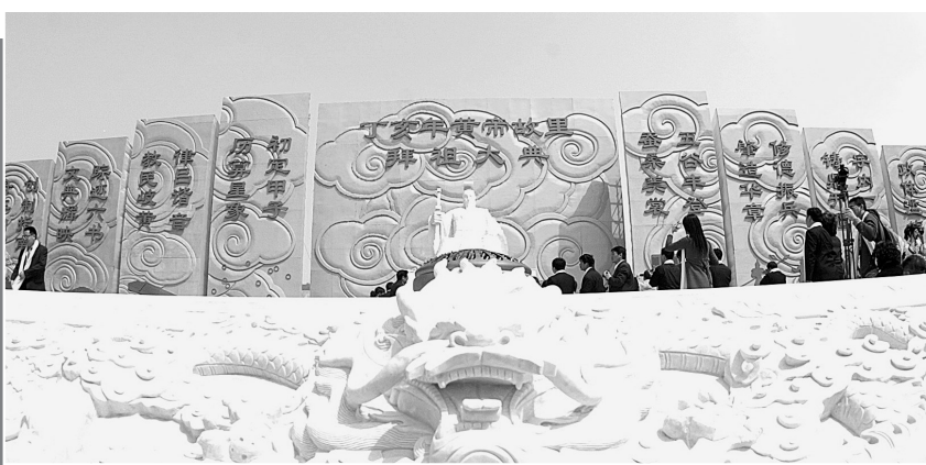
黄帝故里拜祖大典