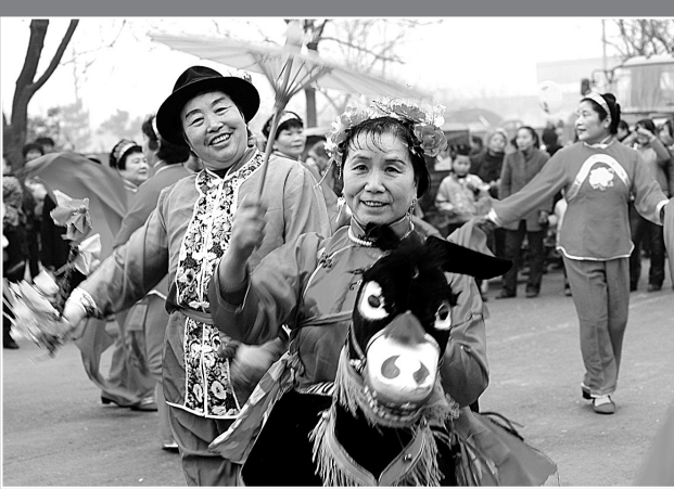
(上、下)市民文化生活快乐多姿。