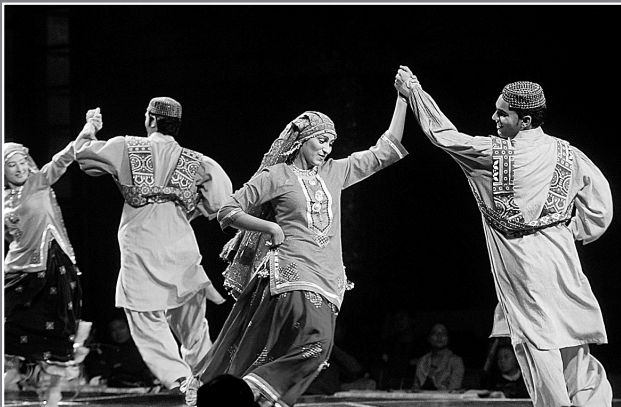
多国演员欢聚亚艺节。