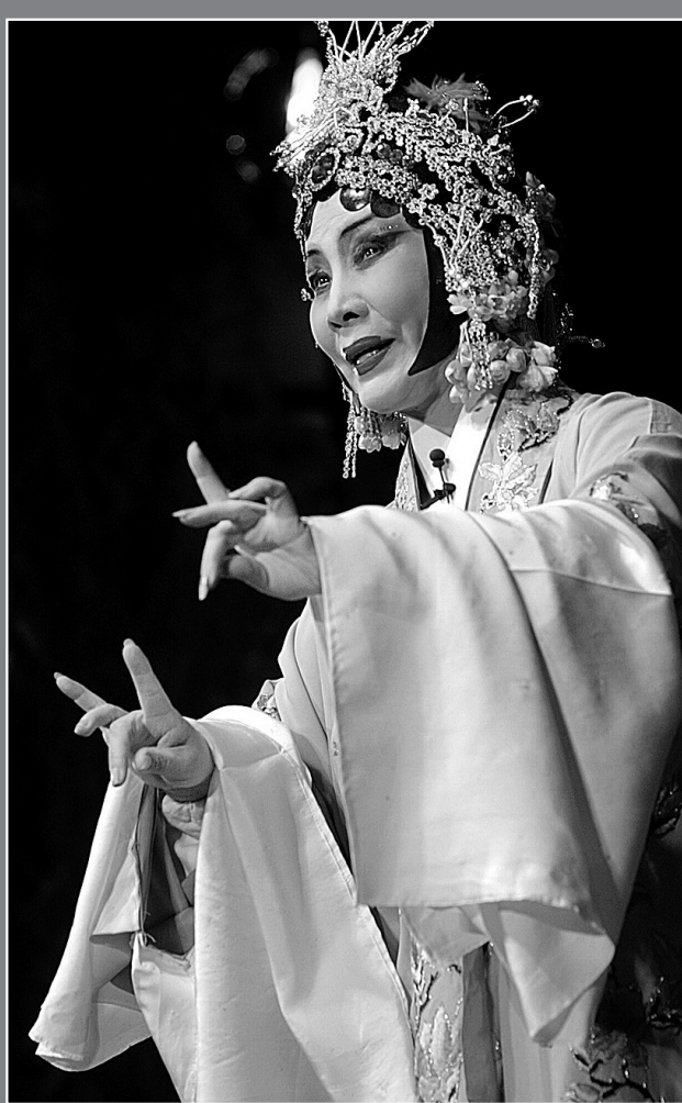
传统艺术河南放异彩。

书近60万册……一系列文化惠民工程的实施,受到农民群众的普遍欢迎,也提升了群众的文化素质。