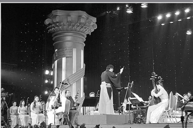
亚艺节闭幕式晚会。