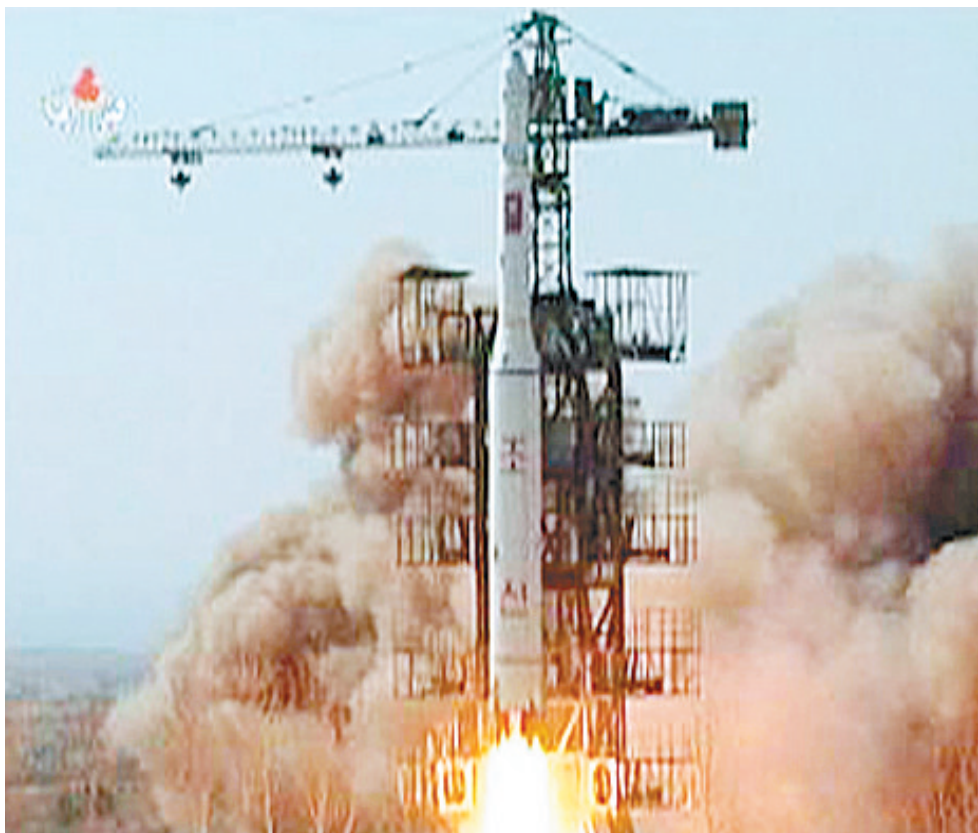
发射画面的视频截图

第1718号决议出台于2006年10月,针对朝鲜核试验活动。这一决议要求朝方放弃核武器和核计划,呼吁有关各方保持克制,继续通过政治和外交努力寻求解决问题。