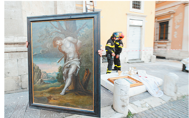
4月7日,在意大利中部地震灾区拉奎拉市老城中心,救援人员从圣玛利亚教堂内抢救出文物。拉奎拉市众多历史悠久的建筑和文物在地震中严重受损,目前救援人员正在加紧从古建筑的废墟中抢救文物。

据报道,除了7日傍晚的一次较强余震之外,当天深夜仍不时有较小余震发生。当地2.5万名流离失所者在帐篷中度过了难挨的一夜。