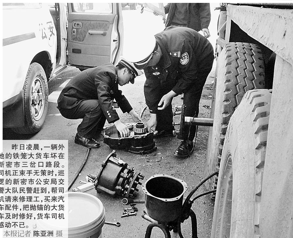
昨日凌晨,一辆外地的铁笼大货车坏在新密市三岔口路段。司机束手无策时,巡逻的新密市公安局交警大队民警赶到,帮司机请来修理工,买来汽车配件,把抛锚的大货车及时修好,货车司机感动不已。

她告诉记者,随着拜祖大典的举办,来自世界各地的炎黄子孙聚集在黄帝故里景区拜谒始祖黄帝,如今景区每天接待讲解的场次能达到40多场,是以往的3倍。 与此同时,作为五千年中华文明的发祥地,国家级森林公园具茨山也成了海内外炎黄子孙寻根游的重要一站。据统计,自三月三拜祖大典结束后,具茨山景区已接待游客近10万人。