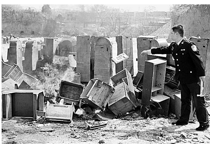
昨日下午,新密警方将收缴的80多台老虎机、苹果机等赌博机一举销毁。

优秀旅游城市、创建文明城市等重大主题,组织当地8个文艺门类的艺术家和邀请省内外文艺家来巩义,走进企业、走进社区、走进景区、走进农村,深入到群众生活第一线,体验生活、激发灵感,精心创作一批讴歌巩义经济社会发展成就,反映当地企业应对金融危机、反映农村建设新变化、农业发展新成就、现代农民新面貌,展示河洛文化、豫商文化、诗圣杜甫等厚重文化资源的报告文学、小说、散文、书画、摄影、曲艺等优秀文艺作品。