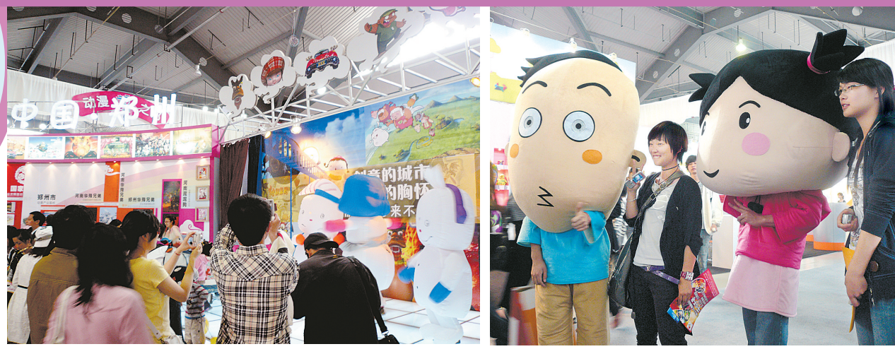
郑州展区人头攒动