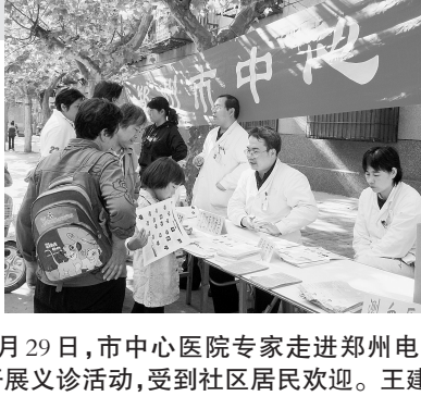
4月29日，市中心医院专家走进郑州电缆厂家属院开展义诊活动，受到社区居民欢迎。

近日，市第三人民医院领导班子全体成员带领各科80余名专家组成义诊团，来到郑州市火车站广场开展“手足口病防治主题义诊活动”。