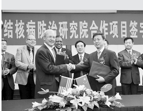
4月29日，美国国家变态反应和传染性疾病研究所与河南省卫生厅在我市举行“中美（河南）结核病防治研究院”合作项目签约仪式。

主治：老花眼、白内障、青光眼、黄斑变性、玻璃体浑浊、近视等 1疗程1个月需10盒，3疗程康复。 外地邮寄货到付款。 电话：0371-66695030 地址：金水路与经八路交叉口北30米玉安堂大药房