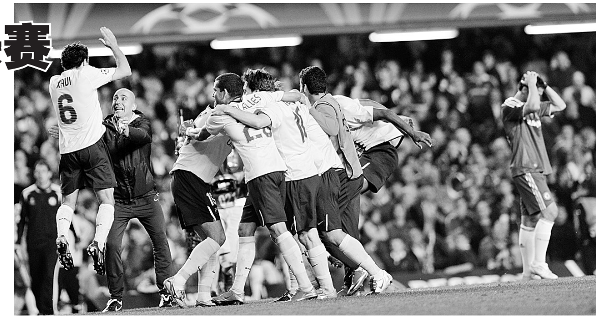
巴塞罗那队球员庆祝胜利。

主裁判亨宁在比赛中多次出现争议性判罚:第24分钟,巴萨的阿尔维斯在禁区内放倒马卢达,亨宁仅判罚任意球,录像回放显示,犯规地点在禁区内应判罚点球。第26分钟,阿比达尔在禁区内绊倒蓝军的“魔兽”德罗巴,亨宁没有做出任何判罚。这一犯规与5日另外一场半决赛中曼联球员弗莱切的犯规相似,弗莱切在触到球的情况下被红牌罚下并吹罚点球,而阿比达尔连球都没碰到。第82分钟,录像显示巴萨后卫皮克在禁区内故意手球,裁判再次漏过了这一足以改变比赛结果的点球。