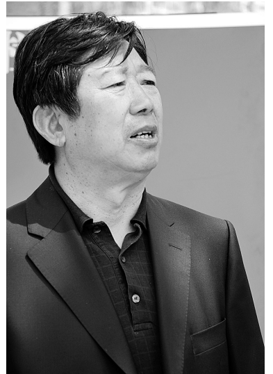
亚洲软式网球联合会副主席、国家体育总局网管中心副主任李有林