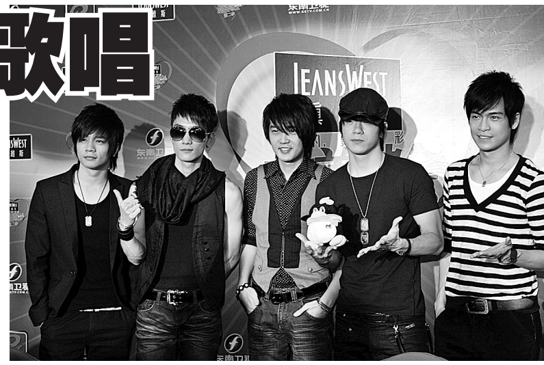
台湾当红偶像组合Kone

自己的发展规划:偶像剧演多了感觉有些“腻”,今后工作的重心将转移到内地,而他本人也非常喜欢像《集结号》这类题材的影视作品,希望有机会出演不同于以往荧屏形象的角色。当晚引发了女粉丝们高分贝尖叫的明道还对记者坦言:和他演出对手