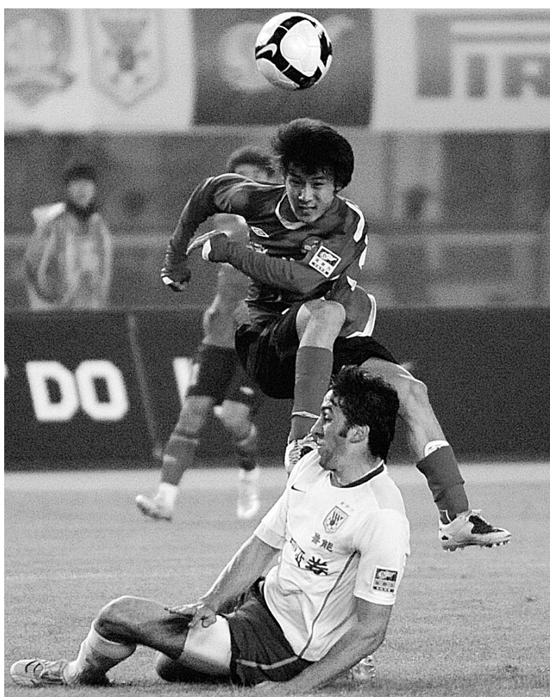
建业队球员(上)在与对手拼抢。