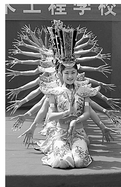
日前,郑州市第四届教育艺术节分会场演出在市艺术工程学校举行。图为市艺术工程学校学生表演的群舞《千手观音》。

根据苏杯规则,小组赛必须打满5盘。在接下来两轮例行公事的比赛中,张亚雯/潘攀和何汉斌/于洋同样以2:0完胜对手。