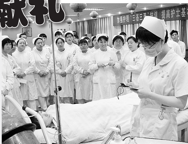
市口腔医院护理部日前对全院护士进行了“三基三严”培训。医院特邀专家进行实地操作及现场讲解。用培训的方式,全院10个科室的50多名青年护士度过了一个特别的护士节。