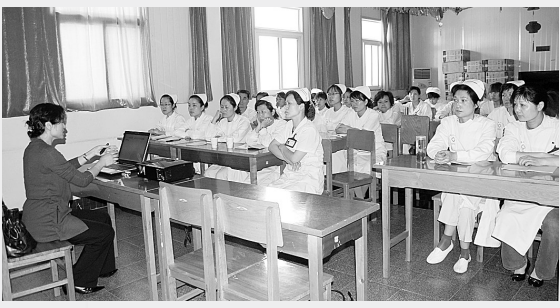
市第十人民医院近日举行了“5·12国际护士节,护士礼仪培训”讲座活动。课堂上,老师精彩的演讲,赢得了护士们热烈的掌声,大家表示受益匪浅。

郑州市高新区社区卫生服务中心即将开诊,为西区居民服务。为了迎接国际护士节,让周边群众了解该院,方便广大人民群众就医,医院组织护士长向当地居民讲解防病治病的有关知识,特别是甲型H1N1流感的预防教育,并向群众介绍我院社区卫生服务中心的专科特色、名医名家、地理位置及诊疗特点,受到了当地群众的热烈欢迎。