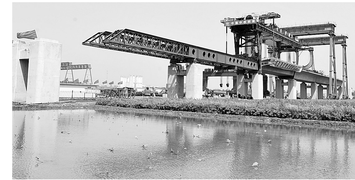
我国“四纵四横”铁路客运专线重要组成部分——石武铁路客运专线河南段第一孔在河南省新郑境内正式开始架梁,标志着该工程进入新的施工阶段。

14000多人,但真正在旅行社行业工作的人群估计不足1/3,如何规范管理这部分导游?据悉,省旅游局将加快建立省、市、企业三级培训体系,提高导游队伍整体素质,严格导游员准入制度,实施“明星导游员工程”,推行《导游员等级考核评定管理办法(试行)》,试行导游员等级考试制度和等级薪酬制度。