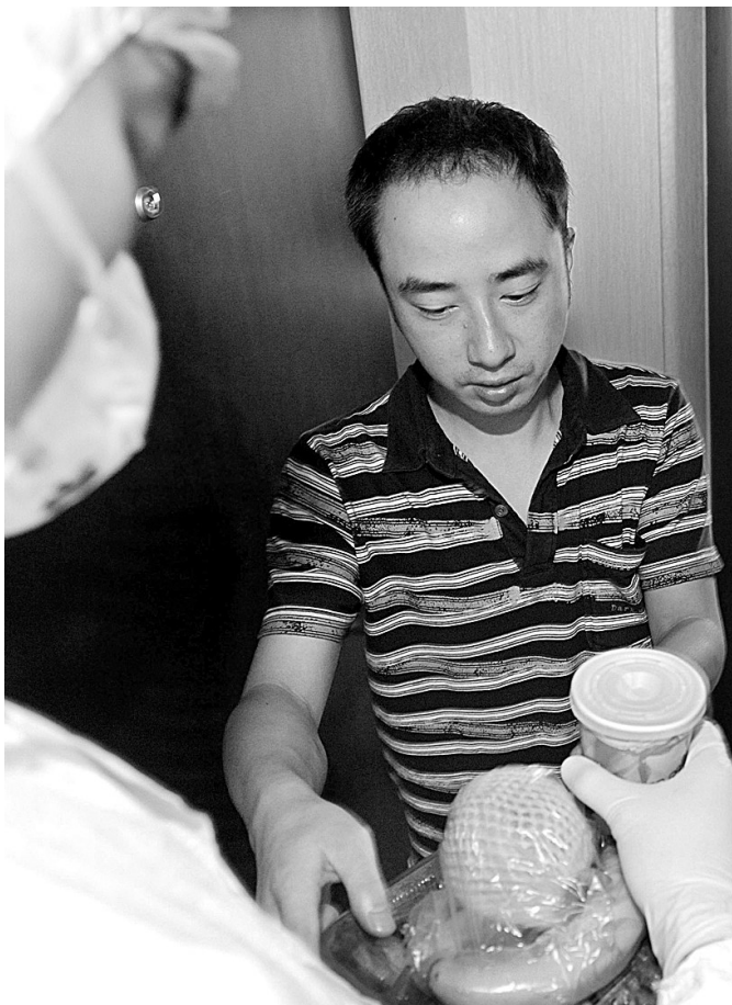
16日,甲型H1N1流感集中观察点——位于成都市龙泉驿区的某宾馆内,工作人员为即将解除医学观察的接触者送餐。

墨西哥流行病学与疾病控制中心负责人则称,该国检测到了发生突变的甲型流感病毒,类似情况在美、加两国也被发现。学者们非常担心新病毒可能更具侵入性。世卫组织官员确认,抗病毒药物达菲对甲型流感病毒仍然有效,目前没有迹象表明该病毒对达菲有抗药性。