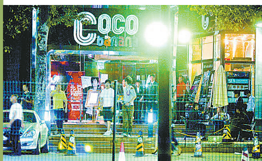
事发酒吧已贴出暂停营业的通知

一向形象健康的歌手满文军爆出意外消息。19日凌晨,北京警方在位于工体附近的一处酒吧内,带走了包括满文军在内的多位演艺界人士,原因是当场发现了摇头丸等毒品,而在随后的毒品测试中,满文军及其妻子尿液均呈阳性,令圈内外一片哗然。记者20日从北京警方证实,满文军等10人被依法行政拘留,一人被依法刑事拘留。