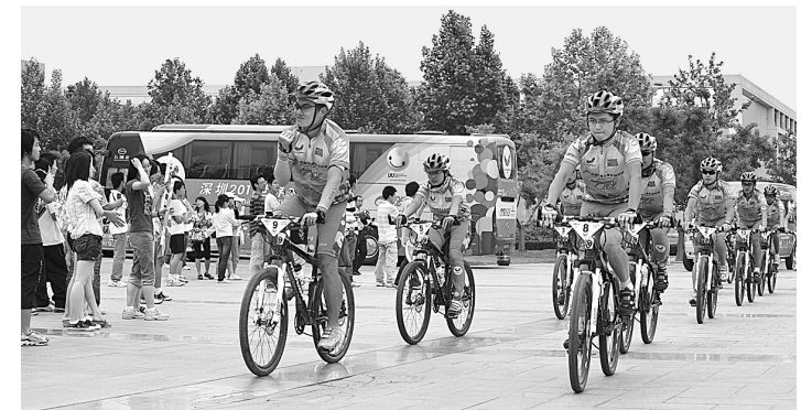
昨日下午,第26届世界大学生运动会“北京—深圳—贝尔格莱德”文化骑行活动抵达郑州站,12名大学生骑行志愿者分别来自北大、清华、深大等9所高校。2011年8月,第26届世界大学生运动会将在深圳举行,为此,深圳第26届大运会执行局将派代表团赴贝尔格莱德(今年7月贝尔格莱德将举办第二十五届世界大学生夏季运动会)参加接旗仪式。本次大运文化骑行是“2009,世界大运会进入深圳时间”系列文化活动之一。

5月22日,作为曲剧艺术节主体活动之一的“当代中国十大曲剧名角”决赛在汝州进行,通过预赛产生的20名选手以各自拿手的折子戏进行现场“较量”,经过评委专家的认真评审,首届中国曲剧“当代中国十大曲剧名角”顺利出炉:孙玉香、张娜、孔素红、邱德福、尚小双、张明云、郭秋芳、黄德华、姚军良以及陆鹏、张晓红(并列)获得当代中国十大曲剧名角称号。