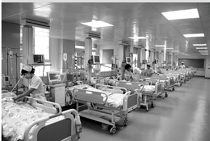
重症监护设备一流