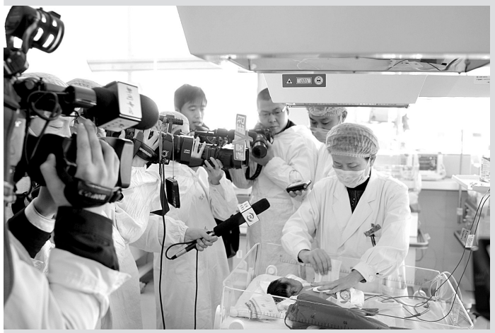
连体婴儿成功分离