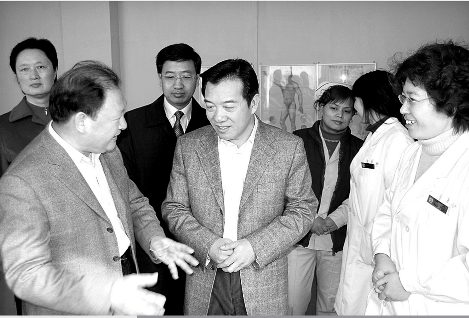
市领导关爱患儿康复

今年一开春,“发病早、来势猛、病情重”的手足口病又一次向孩子们袭来。河南省明确手足口病重症救治定点医院有两家,市儿童医院是郑州市唯一一家。