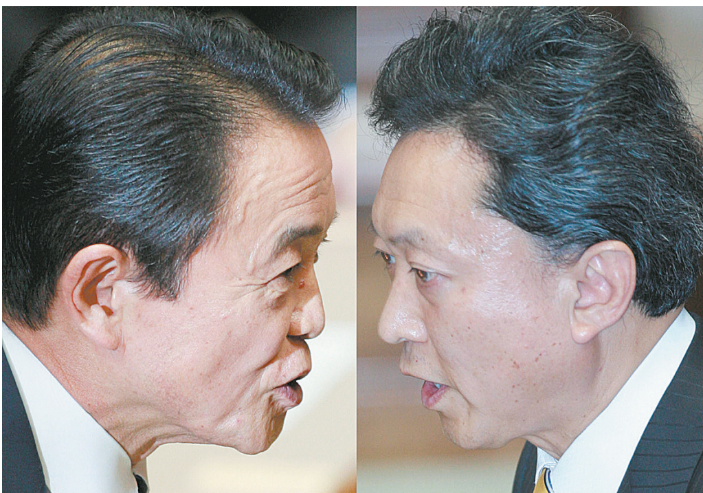
5月27日,在位于日本首都东京的国会参议院,日本首相、执政的自民党总裁安倍晋三(左)与最大的在野党民主党党首鸠山由纪夫(右)在两党党首辩论会上面对面交锋(本版照片)。新华社

据新华社东京5月27日电 日本执政的自民党总裁、首相麻生太郎与最大在野党民主党新代表(即党首)鸠山由纪夫27日举行今年首次党首辩论。这也是鸠山作为民主党新代表参加的首次党首辩论。