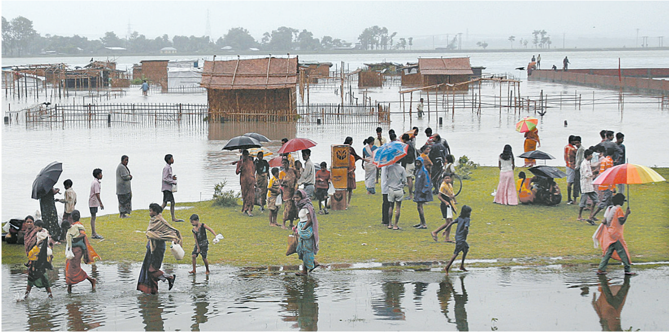
5月26日,受灾居民向安全地带转移。