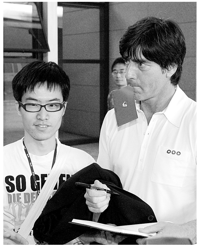
5月27日,德国主帅勒夫(右)在上海浦东国际机场为球迷签名。当日,德国队一行抵达上海。他们将于5月29日与中国队在上海体育场进行一场足球友谊赛。

地的热身训练。这两天,中国女排的训练也主要围绕体能恢复和技术训练展开。观看古巴女排比赛录像,也成了女排姑娘们这两天的“必修课”。 另据了解,在此次四国女排精英赛期间,为中国女排获得五连冠立下汗马功劳的部分老女排队员也将来到漯河,她们除了观看比赛以外,还要通过座谈会等形式,给新一届中国女排出谋划策,以便使她们能尽快重返世界女排的最高领奖台。