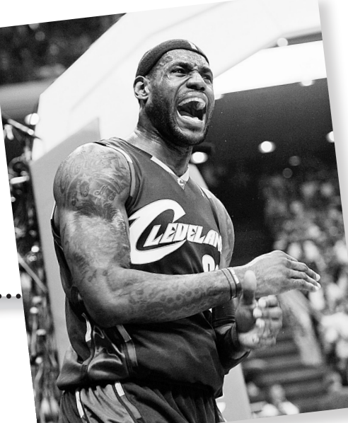
左图:“魔兽”霍华德成为加时赛的决定性因素。 右图:“小皇帝”孤军难鸣。

也就只能是孤注一掷的赌博。“皇帝”真的发蒙了,他蒙队友为何无法帮他分忧,他更蒙上帝究竟是在眷顾他,还是在戏弄他。 皇帝蒙了,骑士悬了。赢或者回家,对于骑士而言仅剩下一场比赛。“皇帝”詹姆斯不能再继续犯蒙,他必须信任队友,他必须放下架子,他更必须摆正心态,也只有这样,他和他的骑士才能化险为夷。 本报记者 陈凯