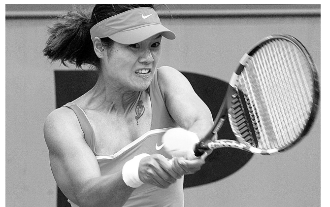
5月27日,中国选手李娜在比赛中回球。当日,在2009年法国网球公开赛女单第二轮比赛中,李娜以2:0战胜瑞士选手巴辛斯基,顺利晋级。

本报讯(记者 陈凯)昨日,记者从省乒乓球网球运动管理中心获悉,由国家体育总局乒乓球羽毛球运动管理中心、中国乒乓球协会会员联赛委员会、河南省乒乓球协会、河南省直属机关工会工作委员会承办的2009年CTTA中国乒乓球会员联赛(郑州站)将于今日在河南省体育馆拉开帷幕。 据悉,中国乒乓球会员联赛是我国业余乒乓球的顶级赛事,今年的比赛也是我省连续第三年承办该赛事的分站赛。今年的中国乒乓球协会会员联赛共有14站,总决赛将于11月13日~16日在湖北省武汉市举行。获得赛事各分站赛团体和单打冠军,总决赛团体比赛和单打比赛前三名者可向中国乒协申请授予业余运动健将证书。获得赛事总决赛各站别前八名的运动员,可以免费报名参加2010年在内蒙古自治区呼和浩特市举行的世界元老锦标赛。 另据了解,报名参加此次郑州站比赛的选手达到了470余名,参赛人数远远超过了往届郑州站比赛的参赛人数。