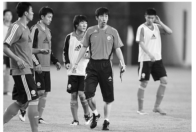
5月26日,中国国家队主教练高洪波(右二)带领队员训练。当日,中国国家队继续在上海金山体育场训练,积极备战将于5月29日与德国队的足球友谊赛。