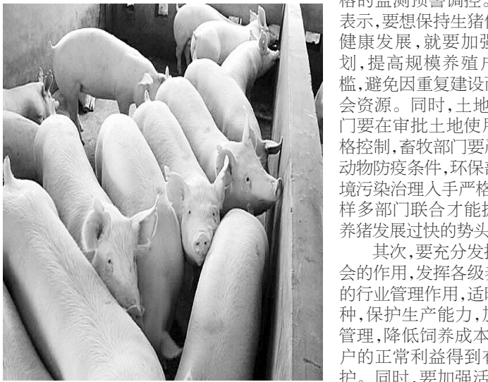
无忧无虑的猪不知道自己的身价已下跌