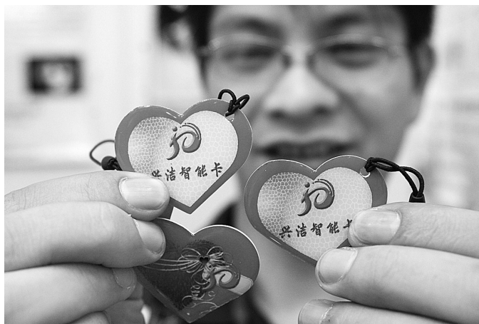
6月3日,2009中国国际智能卡与电子标签博览会在京开幕。展会吸引了来自中国、英国、德国、日本、韩国、新加坡等国家的约150家智能卡和电子标签相关企业参展。图为工作人员展示心形ID卡。该卡可用在消费、考勤等领域。 新华社发

对此,不少旅行社不失时机地推出“毕业游”新线路。金水路一家旅行社主推的“毕业游”项目、线路等都可以由学生自己安排,服务费也比较便宜。“最火的是5月底,一个周末有3个毕业班,共100多人一起出发。”该旅行社负责人金小姐说,每年大批高校毕业生组织“毕业游”,这是一个不小的商机,此外,旅行社也想通过此举留住这些未来的潜在消费者。