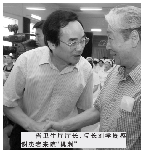
省卫生厅厅长、院长刘学周感谢患者来院“挑刺”

向社会公开征集遇到过不愉快就医经历的患者,为医院的服务“挑刺儿”,给全体医务人员讲述心声,为医院改进医疗服务献计献策,完善医疗服务。