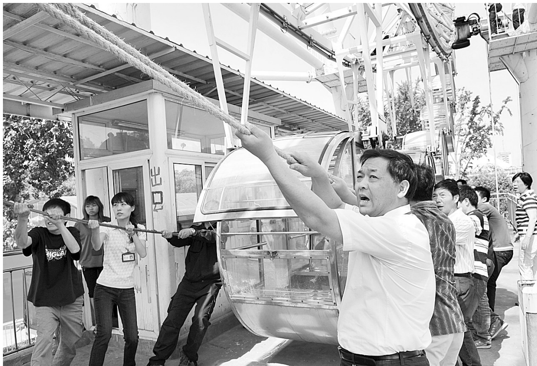
为减少和杜绝大型游乐设施安全事故,昨日,郑州市人民公园举办了一场摩天轮突遇停电紧急救援游客现场演练。现场有关负责人告诉记者,夏季是用电高峰,为防患于未然,公园在专家指导下开展了这次紧急救援演练,以便在遇到类似情况时能有条件不紊开展救援。

核均为称职以上的,安排副科级职位;硕士生选调生享受副主任科员待遇,在乡镇工作满2年、年度考核均为称职以上的,安排乡镇党政副职;大学生村干部在乡镇工作满1年、年度考核称职以上的,安排副科级职位;博士生选调生安排主任科员,试用期满考核合格的,安排副县级职位。