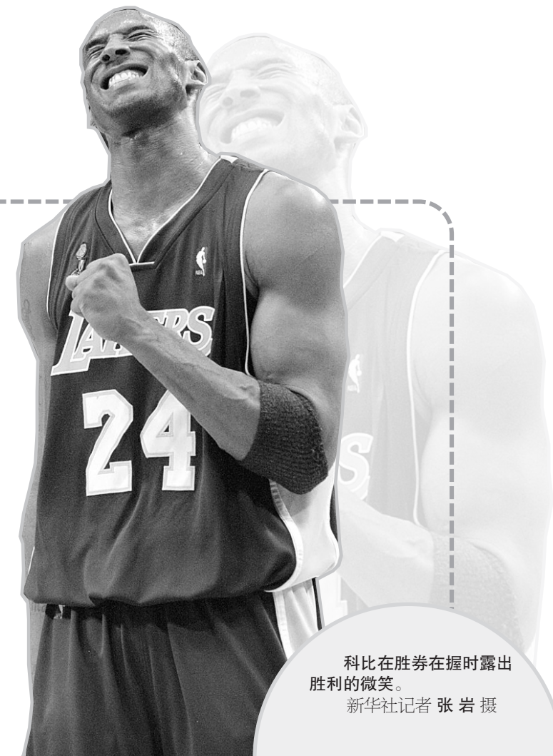
科比在胜利时刻露出胜利的微笑。

当晚, 加州州长施瓦辛格打电话给杰克逊祝贺他和球队夺得总冠军。可因经济衰退, 湖人队像历届冠军那样在本城举行大游行活动, 很可能因洛杉矶市政府无力支付逾百万美元的费用而泡汤。