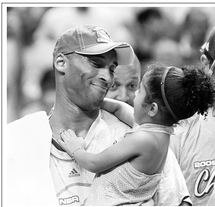
科比与女儿共同庆祝胜利。