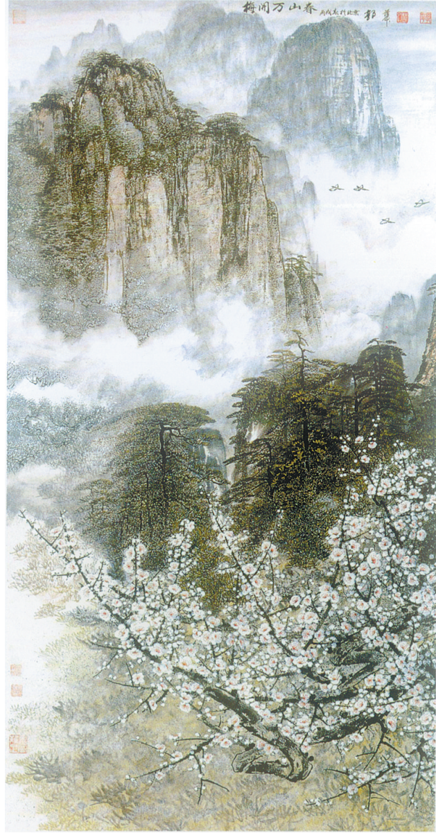
梅开万山春(国画) 郭华

小赵号称“酒缸”,他常狂言:“论喝酒,我赵某人服过谁!”一天,应朋友相约来到一家酒店。酒过三巡,大家看到小赵脚步踉跄,扶墙而行,一位朋友上前问他:“赵老弟,今儿个你服不服?”小赵还是脖子一梗,说:“我……服……服谁?我只是扶……扶……扶墙!”