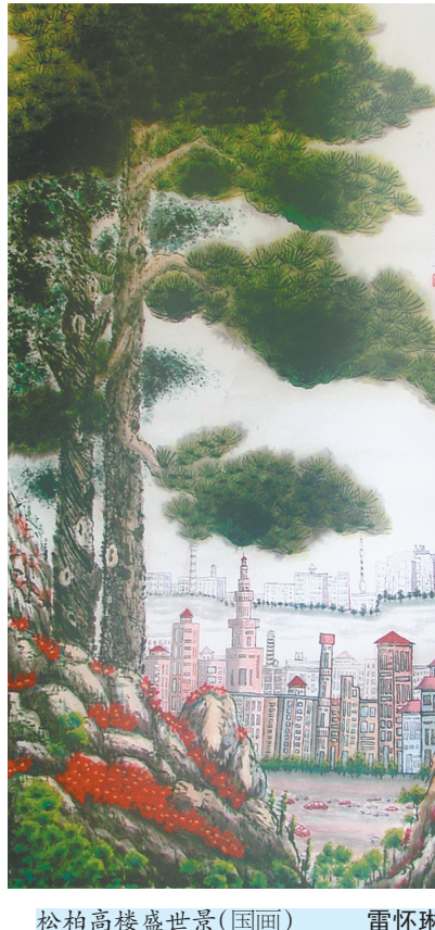
松柏高樓盛景(国画) 雷怀琳