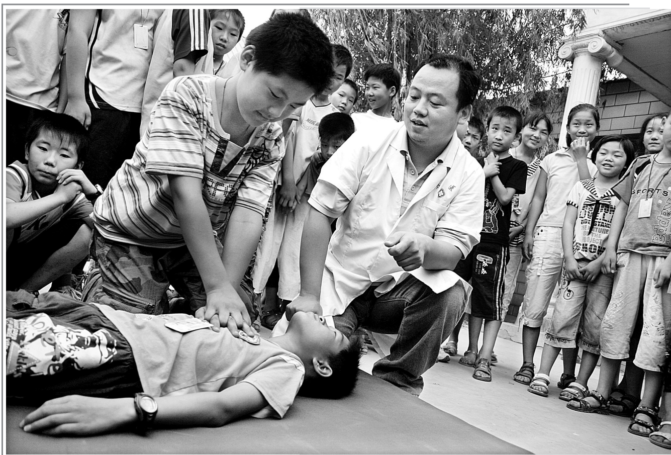
暑假临近,学生们在暑假该注意些什么?如何保证安全?昨日,荥阳市乔楼镇第一中心小学邀请公安、卫生方面的专业人员,对即将放假的孩子们进行一系列的安全教育。图为医务人员教授学生们一旦发生溺水事件后,如何在第一时间进行急救。本报记者 谢庆 摄

按照计划,该市将在荥阳市道路主干道设置8块旅游交通引导标志,主要设置在西南绕城豫龙站出口,郑上路三岔路交叉口,郑上路、荥密路口转盘口东,连霍高速高村出口,荥阳高村乡与S314路口广武方向,新310与荥密路口等路段。该项目由荥阳市旅游局牵头组织实施,落实专人负责。目前,规划选址工作已完成,预计可在8月20日前全部完成。