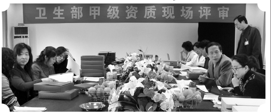
卫生部甲级资质现场评审