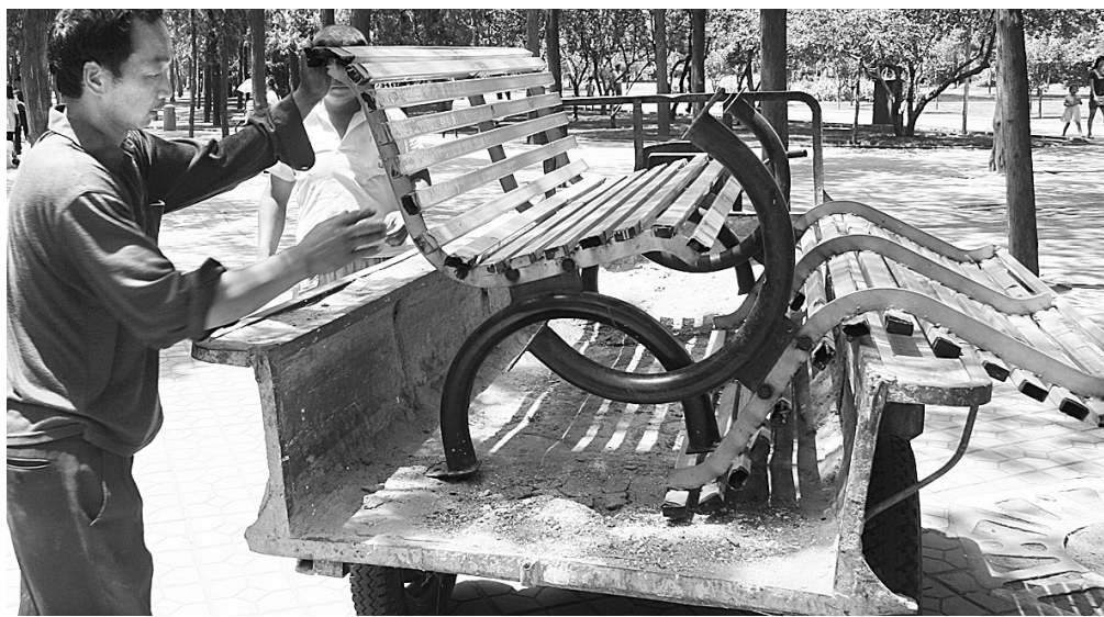
本报昨日报道了碧沙岗公园座椅受腐蚀变“尖刀”的事情后,碧沙岗公园管理处当日即拆除了58个破损的椅子,还对全国的公共座椅进行了一次大修整,并已联系有关部门,争取在拆除位置早日安上新座椅。

据悉,2009年全国专利代理人资格考试将于12月5日至6日在郑州等15个考点城市同时进行。报考者必须符合的条件为:18周岁以上,具有完全民事行为能力;高等院校理工科专业毕业或者具有同等学历;熟悉专利法和有关的法律知识;从事过两年以上科学技术工作或者法律工作。报考人员可在国家知识产权局或省知识产权局网站下载报名表。