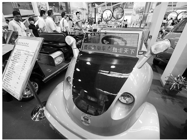
6月28日,第四届跨国零售集团采购会在南京国展中心开幕,本届采购会涉及400多个大类,1万多个品种。其中,沃尔玛、家乐福等数十家跨国零售集团还首次提交了“出口产品采购清单”,即在国内采购商品到(境)外销售。