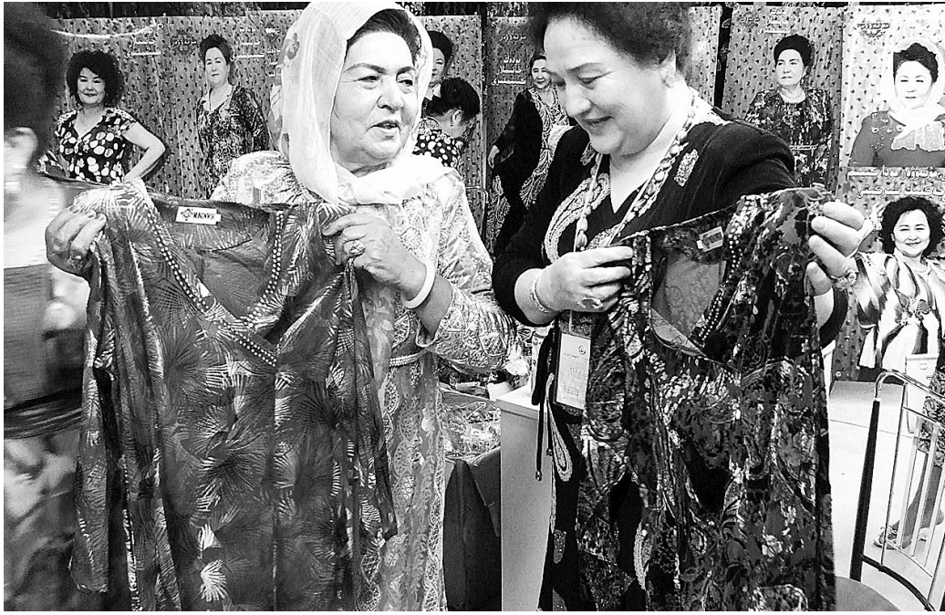
6月28日,第五届中国新疆喀什·中亚南亚商品交易会(简称“喀交会”)在喀什科技文化广场开幕。来自巴基斯坦、塔吉克斯坦等7个中亚和南亚国家,国内15个省市区以及新疆32个经贸代表团的1.2万人参加此次交易会。图为两名维吾尔族妇女在“喀交会”上向客商展示民族服装。

此外,根据国家新的行业污染物排放标准,我市近期还对7家涉铬(均为电镀行业)企业和两家铬渣堆实行限期治理,目前已有3家完成治理任务。