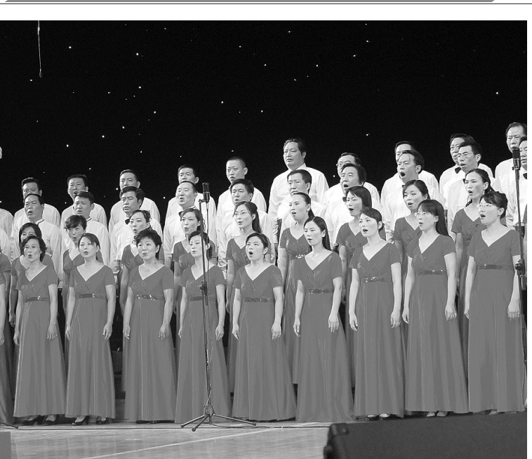
昨日,以国家电网职工之歌《祖国有我》为基本参赛歌曲的郑州供电公司“七一”歌咏比赛,在该公司职工礼堂火热开唱。《祖国有我》创作于南方冰雪灾害和四川汶川大地震发生之后,孕育于广大电网员工抗冰抗雪救灾之中。展现了电力职工经得起考验、能打硬仗、善打胜仗的铁军风范,树立了顾全大局、奉献社会的良好形象。

拜师结束后,河南省豫北红脸豫剧团团团长范军主演了古典戏《斩皇子》,15岁学艺的他曾在豫剧舞台上塑造了一系列艺术形象,他的嗓音洪亮、苍劲有力、穿透力强,被广大戏迷亲切称为“豫北红脸王”。