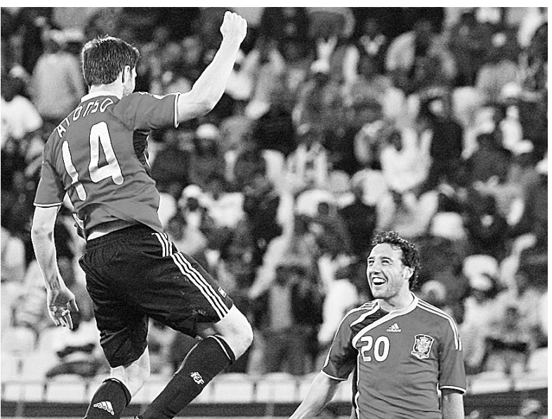
6月28日,西班牙队球员阿隆索(左)在攻入制胜一球后与队友卡索拉克庆祝。当日,在2009国际足联联合会杯季军争夺战中,西班牙队通过加时赛以3:2战胜南非队,获得季军。

德万斯卡时显得办法不多,并且失误连连。仅1小时33分钟,李娜就以4:6和5:7的比分告负。 赛后李娜对自己过多的非受迫性失误感到很无奈,“今天我不在状态,对手几乎不用做别的,只要把球打进场内就行,我自己就会出现失误。”