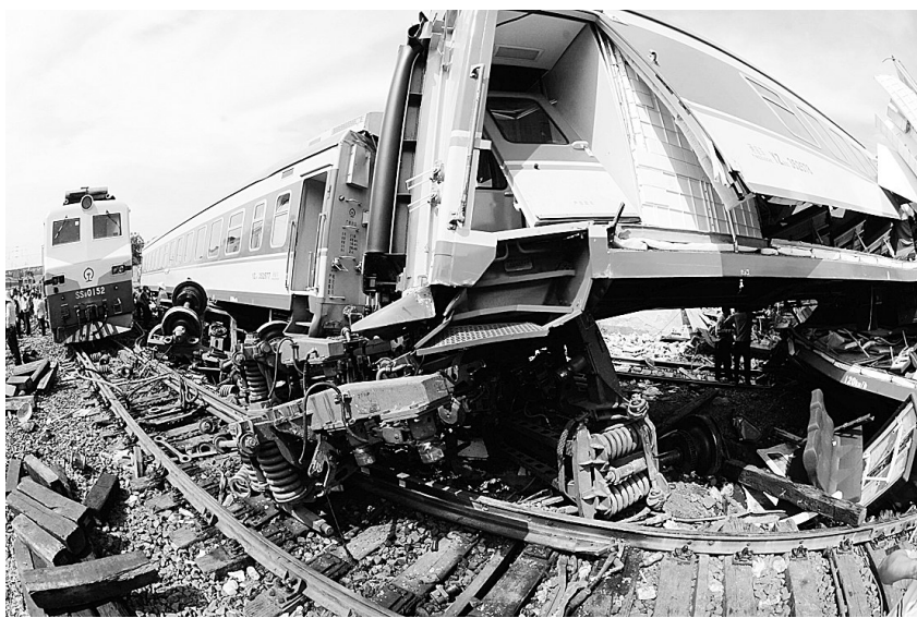
郴州列车相撞事故现场。

2位车辆脱轨。 据介绍,K9017次客车与正在出站的K9063次客车发生侧面冲突事故后,铁道部与广铁集团公司迅速启动应急预案。 在外地检查运输安全工作的铁道部部长刘志军立即赶赴现场组织指挥救援工作。郴州市紧急成立了事故处置临时指挥部,全力抢救伤员,维持治安秩序,协助铁路部门搞好旅客分流。记者获悉,目前受伤人员全部被就近送往郴州市内各家医院救治。 据悉,对事故原因的调查已经展开。