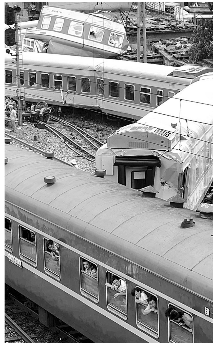
6月29日,一列载客列车(下)驶过相撞事故现场。

人员向新华社记者介绍,K9017次列车进站时本应停车靠站,但不知何故列车直接冲向刚刚启动的K9063次列车,由于当时速度很快,导致K9017次列车出轨撞向K9063次列车。