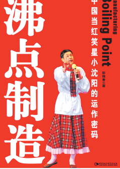
沸点制造,中国红女星小沈阳的运作密码

甚至小品的名字——原定名《星光大道》最后改为了《不差钱》,都凸显了赵本山的一番苦心——现在的农村人“不差钱”了,但差的是向社会主流挺进的通道和梦想实现的平台这样的反讽与隐喻,使得小品在表面搞笑之外,有了深切的时代质感和社会体温。不仅在题材的选择上既为小沈阳“看菜下饭”,又与春晚的要求“无缝对接”,而且在具体的表演上,赵本山和毕福剑也甘当“绿叶”,以便让小沈阳在最短的时间内最大限度地“盛放”。赵本山说:“我多说一句话就会把徒弟的话挤没了,所以我还是保持朴实老爷爷的样子。”并不止一次地叮嘱小沈阳:“我哪怕一声不吱,站着陪你演完,你能火就行。”他还要求毕福剑收起其在主持《星光大道》时的幽默功夫,把自己放在一个纯粹的农村环境里去倾听,去发现。毕福剑是辽宁大连人,也是农民出身,自然很容