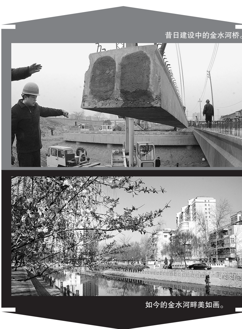
昔日建设中的金水河桥。