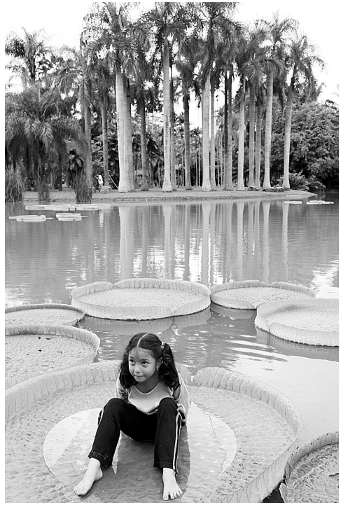
7月7日,中国科学院西双版纳热带植物园推出暑期“王莲载人”体验项目,6名小朋友成为第一批体验者。王莲叶片硕大,犹如浮在水面上的翠绿色大玉盘,最大的可承重数十公斤而不下沉。

据了解,我省早已经推出省内特快专递“限时未达,原银奉还”的承诺服务。2005年7月25日,中国邮政已与澳大利亚、日本、韩国、美国和香港等国家和地区的邮政部门共同推出邮政EMS国际承诺服务。这次中国邮政与英国、西班牙邮政联合,7月8日起正式推出邮政EMS国际承诺服务,也标志着中国邮政EMS承诺服务扩展至欧洲。