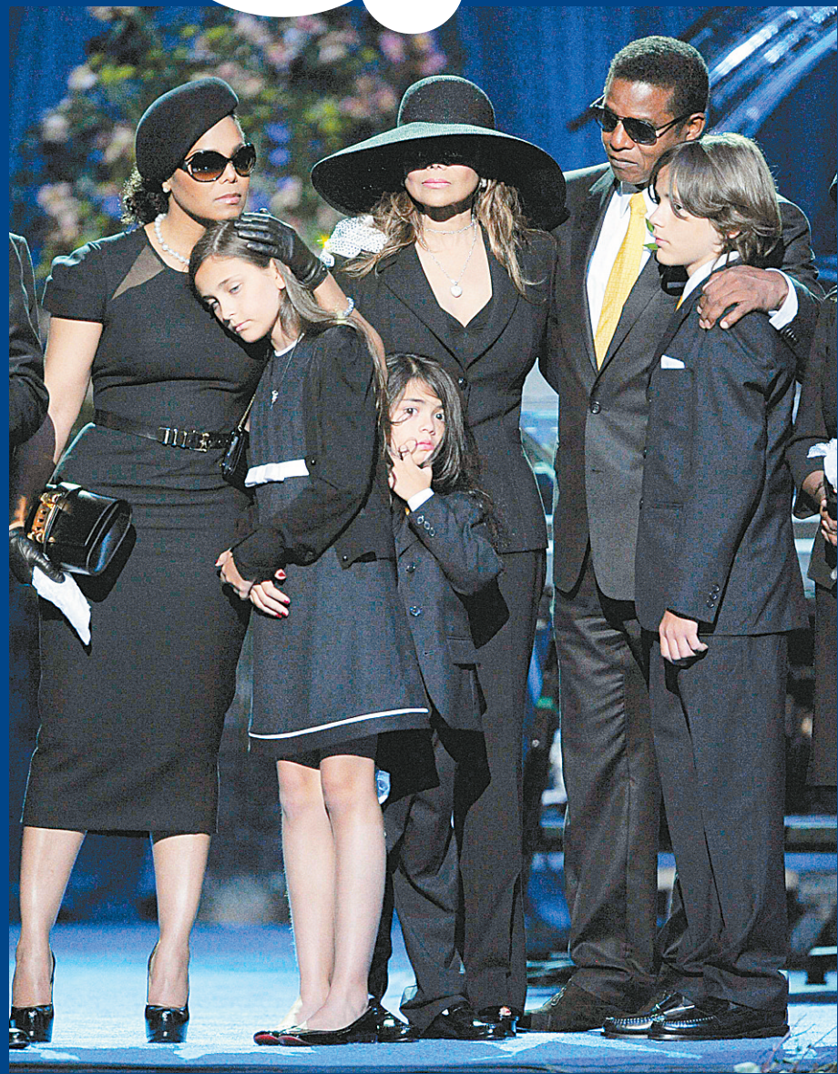
上图:迈克尔·杰克逊的子女和兄弟姐妹在美国洛杉矶斯台普斯中心共同缅怀迈克尔·杰克逊。

杰克逊6月25日因心脏病停止跳动被送入洛杉矶的一家医院后宣告死亡,目前警方对他死因的调查仍在进行中。出生于1958年的杰克逊是美国流行乐坛最有影响的歌手之一,从艺40多年来创下销售专辑7.5亿张的世界纪录。他是第一个频繁出现在美国主流电视上的黑人艺人,并且因积极从事慈善事业而受人称颂。从上世纪90年代后期起,两起对杰克逊猥亵男童的指控使他的公众形象受到损害,并事实上提前结束了他如日中天的演艺生涯。 新华社记者 曹卫国