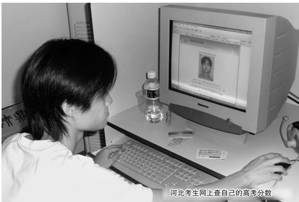
河北考生网上查自己的高考成绩