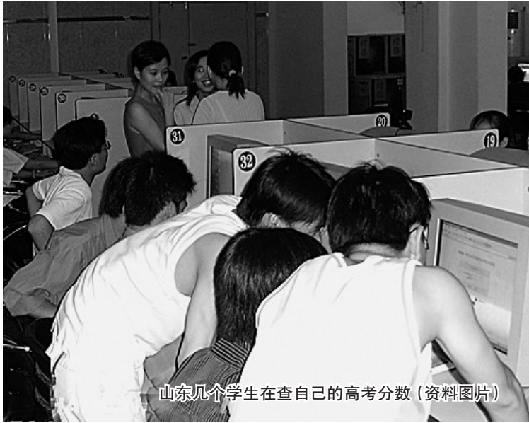
山东几个学生在查自己的高考成绩(资料图片)