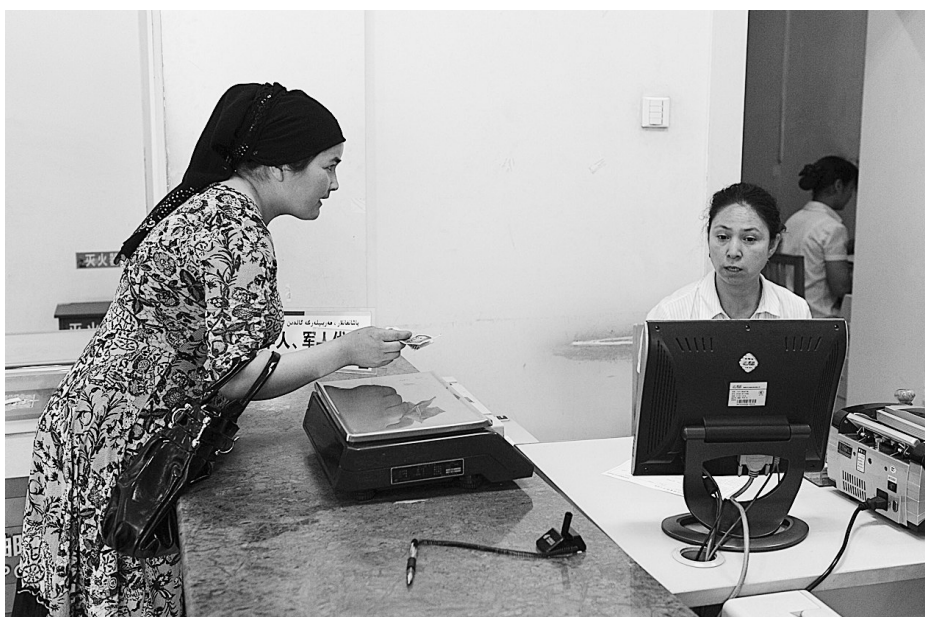
7月14日，一名顾客在乌鲁木齐三屯碑邮政支局办理电话缴费业务。目前，乌鲁木齐市邮政局107个营业网点、69个社区网点和33个投递网点全部恢复正常营业。

随着媒体对“7·5”事件报道的深入，人们发现了越来越多在危急关头不顾个人安危，敢于与暴力和邪恶坚决斗争，各族群众团结互助的感人故事。时穷节乃见，无论是救下18人的年逾八旬的维吾尔族老翁，还是冒死救助汉族群众的维吾尔族职工，都在用自己的实际行动证明着，血浓于水的民族情谊不容破坏。