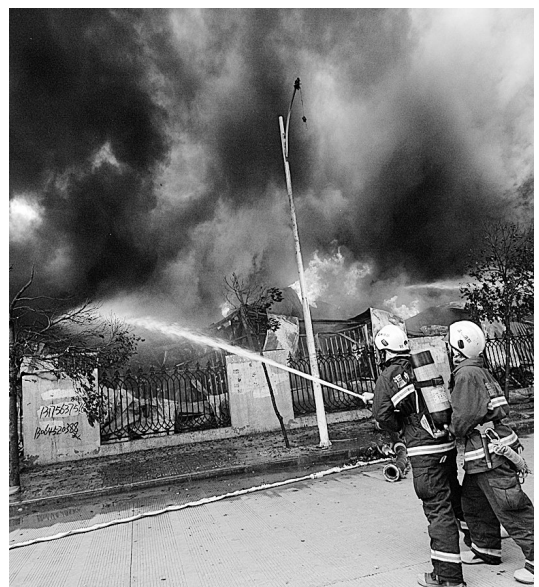
7月19日,浙江省温州市一制笔厂仓库发生火灾。截至记者发稿时,当地消防等部门还在火灾现场进行扑救,人员伤亡及起火原因等有关情况正在调查中。

坎大哈空军基地是北约在阿富汗南部的最大军事基地。北约官员称,坠毁直升机上并没有军事人员,也无迹象显示直升机在遭到敌方火力攻击后坠毁。