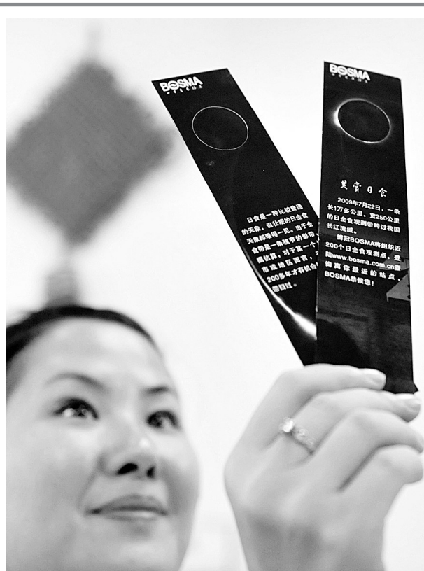
一位女孩在选购日食观测眼镜。

湖北省政府日前召开专题会议,部署应对日全食工作。省政府要求路灯管理部门在日全食发生期间提前打开路灯,确保群众都能安全欣赏日全食。武汉市作为日全食最佳观测地区之一,目前已做好日全食发生时的应对预案。