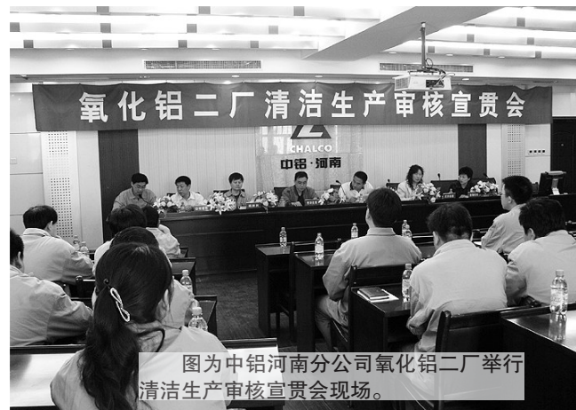
图为中铝河南分公司氧化铝二厂举行清洁生产审核宣讲会。