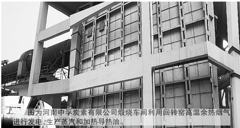
图为河南中孚氟素有限公司煅烧车间利用回转窑高温余热烟气进行发电、生产蒸汽和加热的热岛。

通过不懈宣传和典型引路,清洁生产审核工作逐步得到了大多数企业的肯定和认可,这一好的方法和措施被越来越多的企业接受和运用,实现了由排斥到接受,由被动到主动的转变和飞跃。特别是2008年,呈现出可喜变化:一是企业思想认识提高,工作主动性增强,清洁生产审核工作动员早、部署细。二是企业主动把开展清洁生产审核与加强企业内部管理结合起来,通过清洁生产审核完善了企业各项管理制度,提升了企业的管理水平,改善了企业的厂容厂貌。三是企业的清洁生产审核过程更加细致,审核计划更加合理,方案制定更加切合实际,方案实施的力度更大。四是企业对提升清洁生产水平更加重视,专门聘请行业专家到企业进行指导。五是企业主动把开展清洁生产审核与节能降耗、挖潜增效结合起来。