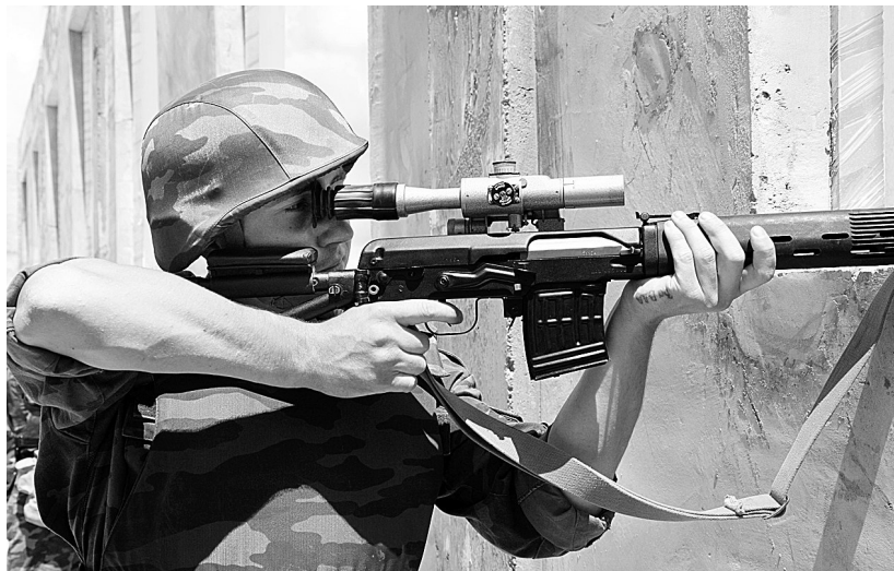
▲参加演练的俄方特种兵狙击手(7月21日摄)。 ▼7月22日,参加演习的中方装甲兵在认真擦拭战车炮管。

“和平使命—2009”中俄联合反恐军事演习22日至26日在俄罗斯哈巴罗夫斯克市和位于中国东北的沈阳军区洮南合同战术训练基地举行。中俄两军各1个战区级指挥机关带1个方向指挥所同步受训,双方参加实兵演练兵力各1300人。