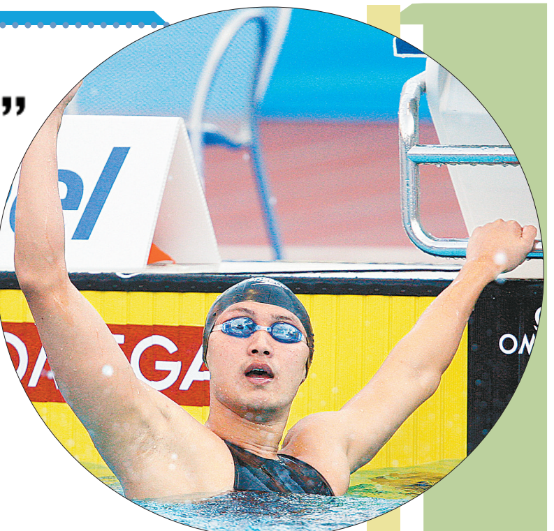
张琳在结束比赛后庆祝。

2009年罗马世锦赛，张琳以7分32秒12获得男子800米自由泳冠军，并打破世界纪录，这也是中国男子第一次获得世锦赛金牌。之前的男子400米自由泳，张琳获得铜牌。