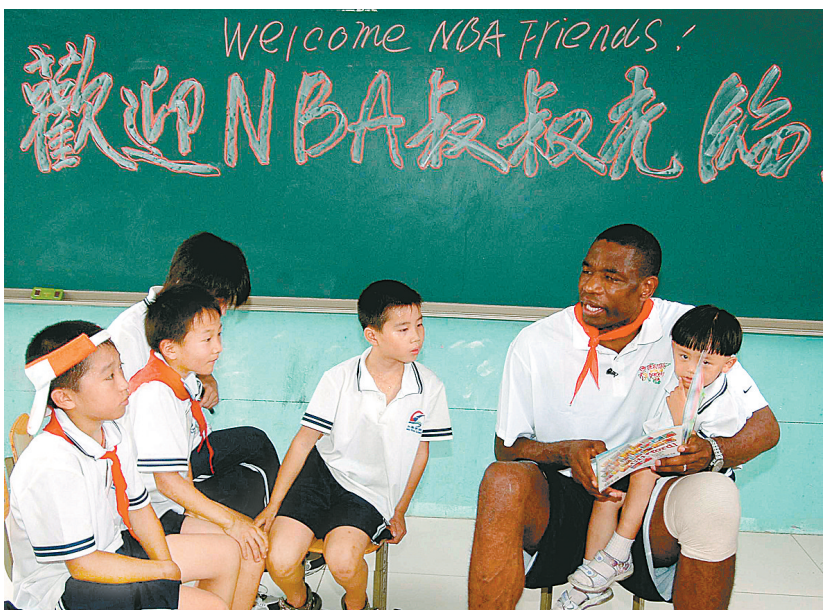
7月30日，穆托姆博（右二）在指导学生练习英文。当日，参加“2009亚洲区篮球无疆界”关怀行动的美国NBA球员和教练来到北京市朝阳区一所打工子弟学校，同这里的学生一起联欢。此前，他们曾向这所学校捐赠了电脑并捐资修建了篮球场。

新华社北京7月30日专电 中国足协纪律委员会30日下午公布了对天津全运会男足甲组球队的具体处罚决定，在26日与北京队的比赛中有违规违纪行为的当事人均受到不同程度的重罚。其中主要“肇事者”赵世桐甚至受到了类似于“终身禁赛”的处罚，而违纪行为最轻的当事人也被停赛5场。 足协纪律委员会依据《中国足球协会纪律准则及处罚办法（试行）》有关规定，开出了一份超长而严肃的罚单：取消天津队12号运动员赵世桐在中国足协的注册资格，并禁止从事任何与足球有关的活动；禁止天津队1号运动员李根、8号运动员郝鹏蛟参加中国足协举办的比赛三十六个月；禁止天津队16号运动员苏力德、13号运动员吴迪参加中国足协举办的比赛三十个月；禁止天津队4号运动员耿鑫、11号运动员范志强参加中国足协举办的比赛二十四个月；禁止天津泰达足球俱乐部官员石勇从事任何与足球有关的活动十二个月；停止天津队14号运动员刘青参加中国足协举办的比赛十场；停止天津队9号运动员梁杰参加中国足协举办的比赛五场；对天津全运会男子足球甲组代表队、领队及教练组提出通报批评。 足协联赛部主任马成全在接受记者采访时说：“在这样的场合（全运会）出这么恶劣的事情，如果只采用一般的措施来处罚将无法起到威慑和预防的作用，这次的处罚的确是相当重的。” 谈到追究裁判的赵世桐，马成全表示，他实在太过分了，居然追着裁判跑了80多米，还将球推翻在地，因此给予重罚。其实在足协规定里并没有“终身禁赛”一说，只有取消在足协的注册资格以及禁止参加任何足球活动，但这和“终身禁赛”的意思差不多。 马成全说：“印象中以前只是在处罚涉嫌假球和黑暗的事件时足协对当事人有过这么重的处罚。至于赵世桐以后是否还能踢球，那得看他在以后的表现。”