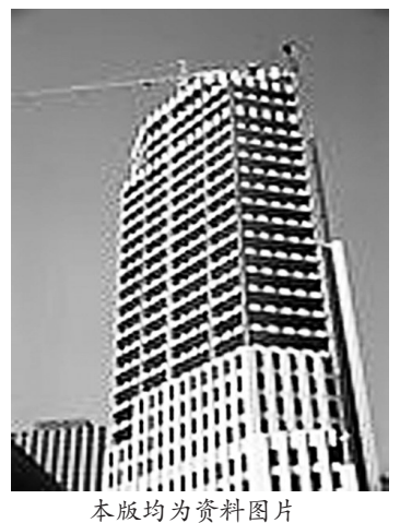
本版均为资料图片

央企与地产的闪婚,让这个本来就充满变数的地产业更加扑朔迷离。“趋势,趋势,我们要趋势”,