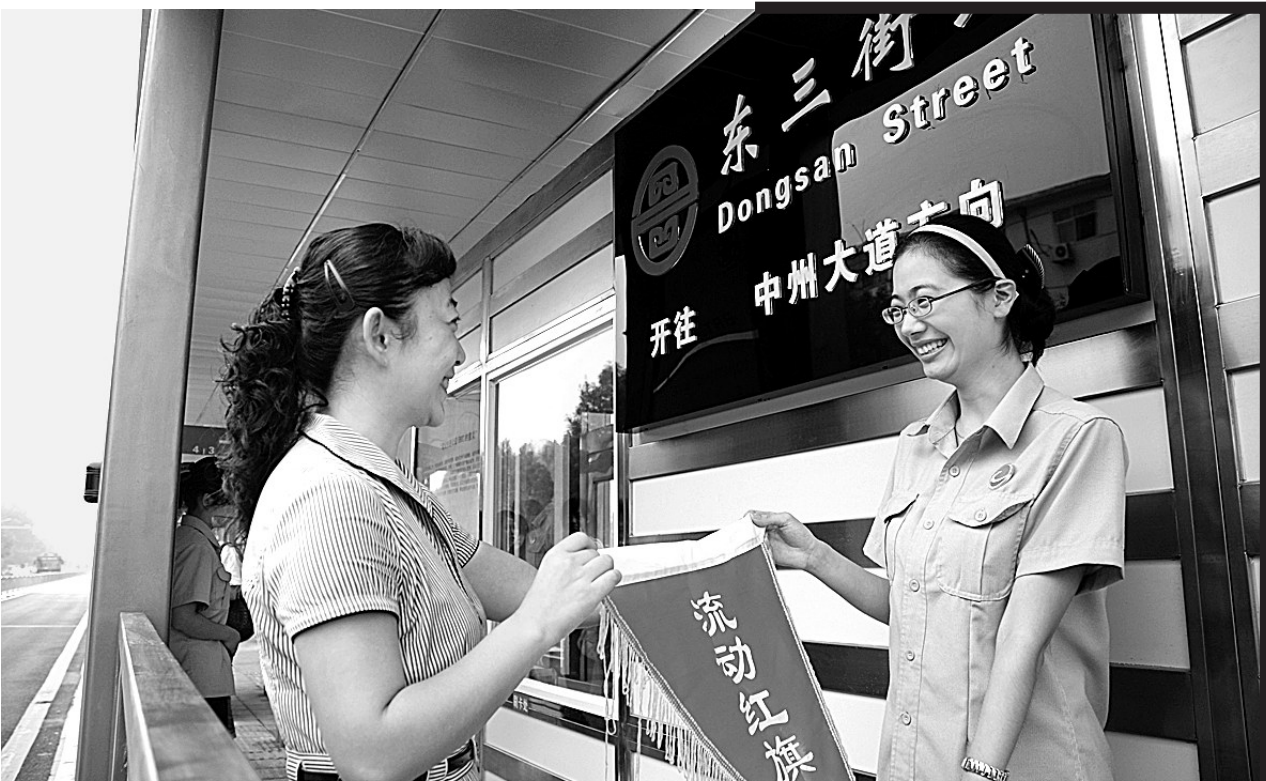
为了提高快速公交站务长的综合业务水平,加强员工的工作责任心,为市民提供更加周到、细致的服务。昨日,郑州快速公交公司为快速公交第一期示范站授牌流动红旗。据介绍,第一期示范站共计四个,分别为:东三街站、工人路站、冉屯路站、商城路站。

纪律处分,并建议有关部门免去其主要领导的职务。对排名后三位的学校,党风廉政建设责任制考核不得确定为优秀单位,建议有关部门暂缓晋升文明单位档次。 据了解,郑州市2008年政风行风评议政府部门综合满意率,在49家政府部门中,郑州市教育局得分86.05排最后一名,开展此项活动是为了切实加强学校行风建设,办好人民满意的教育。