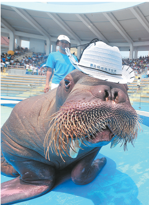
8月13日,饲养员给海象“嘟嘟”戴上了遮阳帽。眼下,青岛市进入了“三伏天”中最热的“未伏”阶段,闷热的天气苦坏了喜好阴凉的海岛极地海洋世界的海象明星们,饲养员通过各种方式为其防暑降温,以保证演出的正常进行。

全国最佳邮票评选活动与中国电影百花奖、中国体育十佳运动员评选活动并列为全国最具影响、深受群众欢迎的三大评选活动之一。此次评选活动由宁夏邮政公司、宁夏文化厅承办。