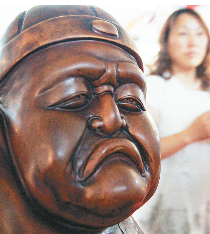
8月13日,一位观众从一个木雕旁走过。正在举行的第五届中国(长春)民间艺术博览会上,展出的木雕形态各异,惹人喜爱。

据主办方介绍,此次大赛较之首届规模更大,预赛已在北京、上海、四川、广东、福建、香港、澳门、台湾等14个赛区的75所高等院校进行。选拔出来参加复赛的近百名留学生将于14日至30日在北京参加“中国印象——认知中国,感受经典”为主题的实践活动和相关比赛。