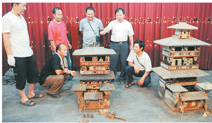
8月13日,文物工作者拍摄新出土的彩绘陶仓楼。

8月12日,在河南省焦作市马村区一个南水北调安置小区建筑工地发现了两座通过耳室连通的东汉早期砖券墓。焦作市文物工作队进行了抢救性发掘,出土两座完整的彩绘陶仓楼以及钱币、陶罐、陶猪等汉代文物100余件。其中,一座高113厘米、宽67厘米、通体彩绘的四层陶仓楼为在焦作地区首次发现。