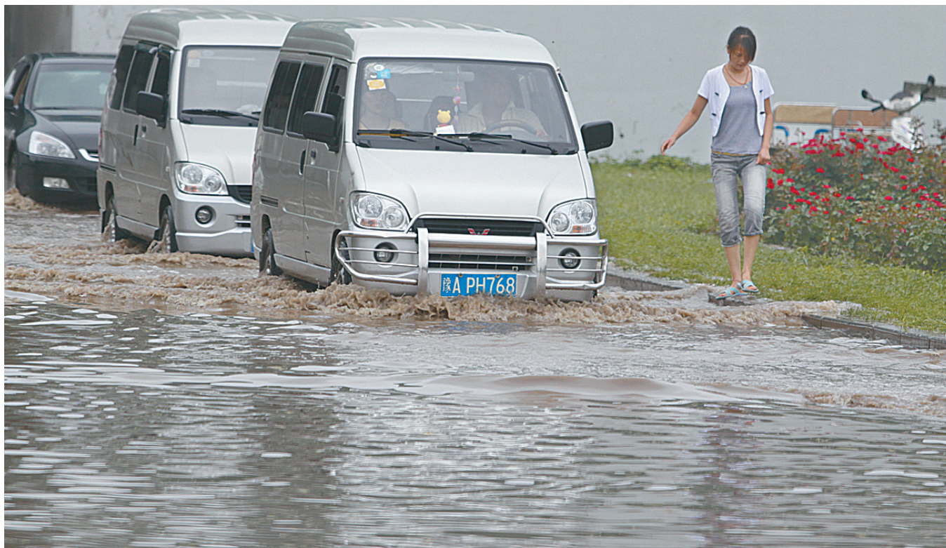
昨日下午,记者在文化路北段的涵洞内看到,过往的汽车在积水中艰难前行,当天的暴雨让文化路北段成了积水的重灾区,截至下午4时,此处积水依旧有30多厘米深。

早上6时一度断行,如城东路立交、航海路立交、沙口立交、新郑路立交快速车道等4座立交,经三路、北环、北环与中州大道、南丰街、天明路、建设东路转盘、二环支路、天河路、郑上路桥下等8条路段,经市政职工组织全力抽升,至10时30分(雨停后2小时),除北环(经三路、中州大道)积水还未退完外,城区大部分道路积水已退完,中心城区各立交桥下均已正常通行。