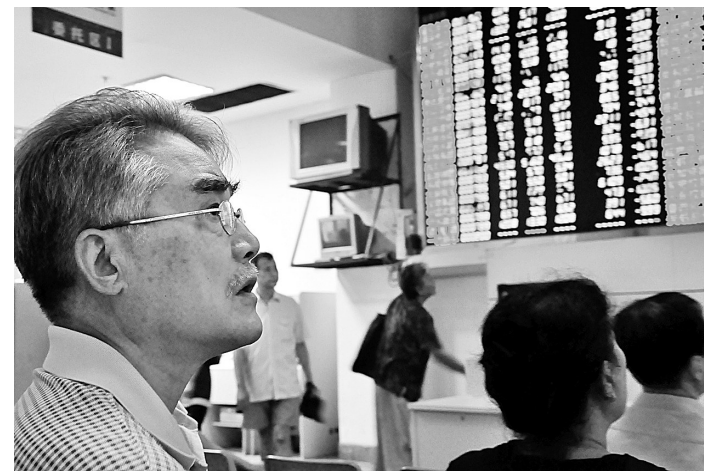
大盘连日暴跌,股民愁眉不展。

中国的铁矿石谈判年内还将继续进行,人们希望有关铁矿石供应方能从FMG的谈判中多悟出些道理,遵循市场规则,共商合理价格,努力推动世界范围内市场和行业的健康发展。