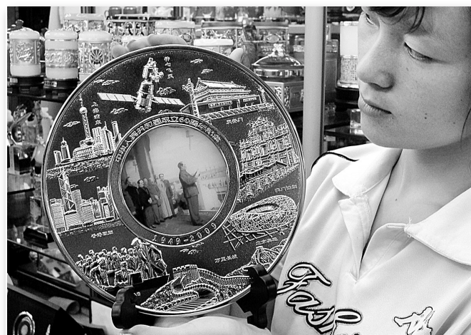
国庆临近,以开国大典、天安门造型等为体裁的红色艺术品迅速升温,昨日记者在火车站附近某小商品城看到,这些艺术品虽然价格不菲,但仍受到市民青睐。