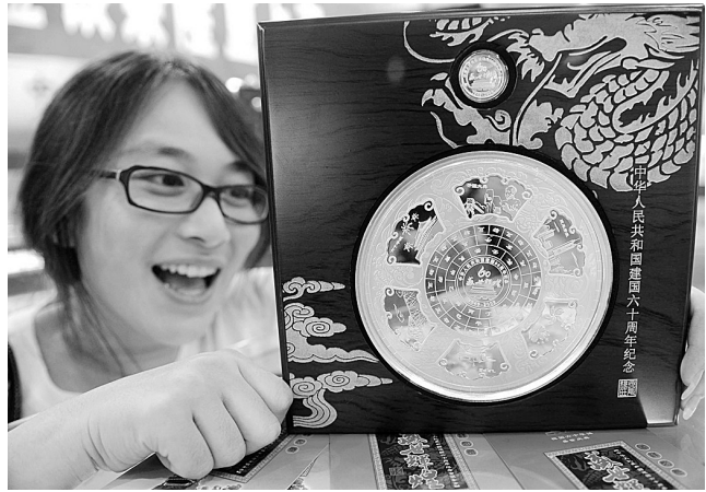
8月26日,一款由8盎司纯银打造的“日晷”银章在北京亮相。这款银章以我国古代的计时仪器“日晷”为设计原型,银章正面记录了开国大典、改革开放等重大事件。