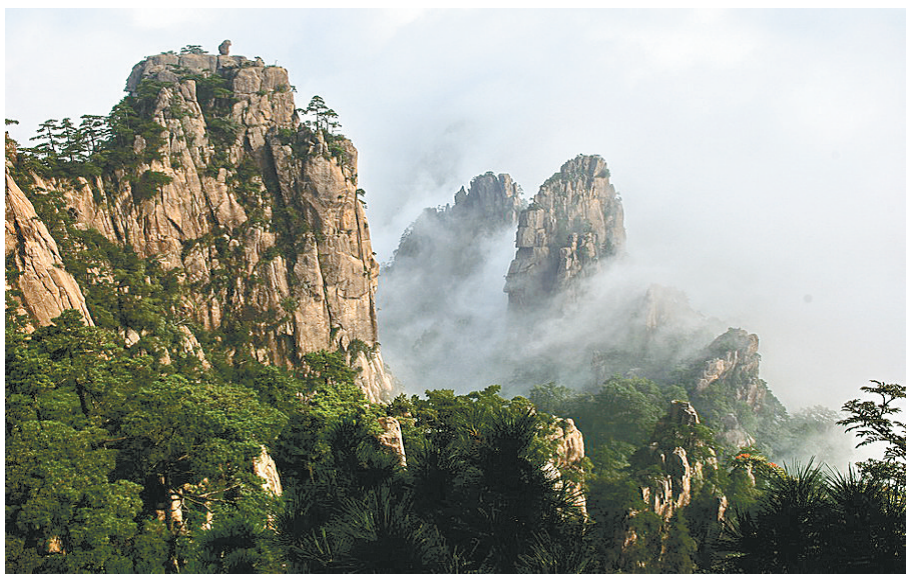
黄山 彭力 摄影

老郑州西关大街西口路南有家汉顺兴成衣店，是1906年京汉铁路通车初期，由湖北省黄陂人庞福随其继父来郑创办的。庞福早年曾在汉口圣昌成衣店学徒三年。学会了做全活、皮、棉、夹、单活、男活、女活样样出色。手艺学成后，跟继父一起带上一台人力缝纫机，一把火烧烙铁（熨斗），来到郑州。买了一对高凳，一块案子做活，租一间门面房，随便起了个南方成衣铺名字，便开始接活了。