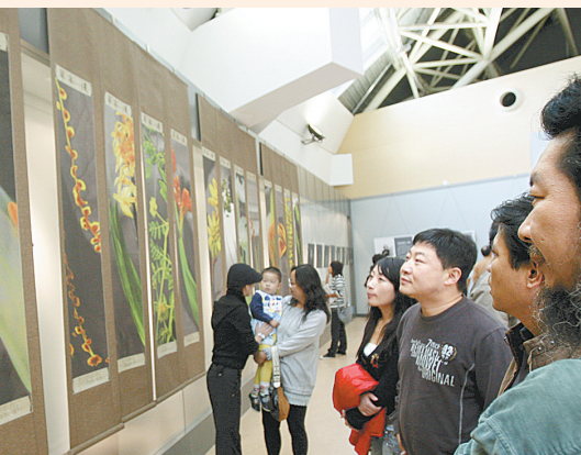
“祖国颂——大型交响诗歌朗诵会”昨晚举行。本报记者 李焱摄

本报讯(记者 秦华文 宋晖 图)昨日上午,“盛世之光——第十一届河南省艺术摄影大展暨河南影像22家作品展”在河南艺术中心艺术馆开幕,两大展览均免费向市民开放,将持续至9月15日结束。 据介绍,由省文化厅主办,省群众艺术馆、省艺术研究院、省艺术摄影学会等承办的河南省艺术摄影大展是我省规格最高的摄影活动,每两年举办一次,今年是第十一届。本届展览自今年3月开始征稿,共收到来自全省17个地市的7000多件稿件。 经过专家的认真评选,共有14幅作品获得一等奖,23幅作品获得二等奖,35幅作品获得三等奖,包括以上获奖作品在内的200幅优秀应征作品参与了本届展览,这些作品代表了我省摄影创作的整体面貌和最新成果。 此外,朱东升、刘梦涛、吴旗等22位省内知名摄影家的作品也同时在河南艺术中心展出。