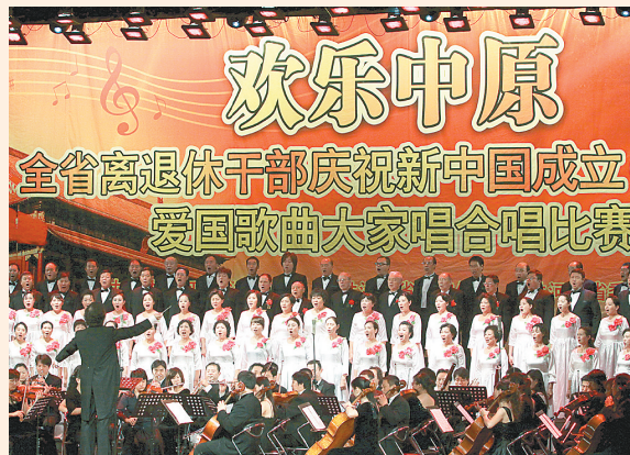
欢乐中原 全省离退休干部庆祝新中国成立 爱国歌曲大家唱合唱比赛

本报讯(记者 李娜 文 李焱 图)昨日上午,全省离退休干部庆祝新中国成立60周年“爱国歌曲大家唱”合唱比赛在郑州市青少年宫拉开了帷幕。来自全省近5000名老干部同唱爱国歌曲,共祝祖国生日。 合唱比赛由省文化厅合唱团的一首《东方红》开始演唱,穿着红色旗袍、脸上刷着腮红的白发老人,精神矍铄地将这耳熟能详的爱国歌激昂演绎。熟悉的旋律和老人们振奋的精神,迎来了阵阵掌声。 据了解,由省委组织部、省委宣传部和省委老干部局组织的此次合唱比赛将历时两天,来自全省75个单位共4662名离退休干部和在职市(厅)级干部共同登台,带来了151个参赛作品。参赛选手大多已霜染两鬓,最大的选手已经80多岁,最大的合唱团有110多位选手,这均是历届合唱比赛中规模最大的。此次比赛结束后,还将挑选优秀的节目进行集体汇报演出。